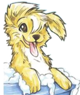
Honden trimsalon Foxy